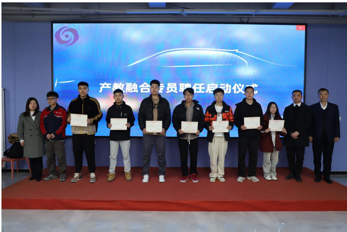
图2-10 产教融合专员聘任仪式