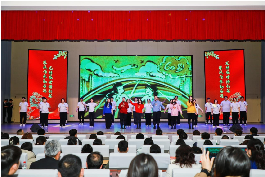
图1-2 家风家教节目演出