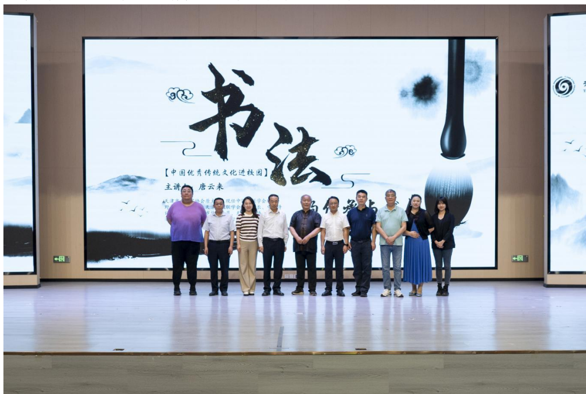
图5-7 师生与书法家唐云来合影留念

为传承和弘扬传统文化，学校邀请书法大家举办书法讲座。（如图5-7、图5-8所示，图片来源：学校新媒体中心）