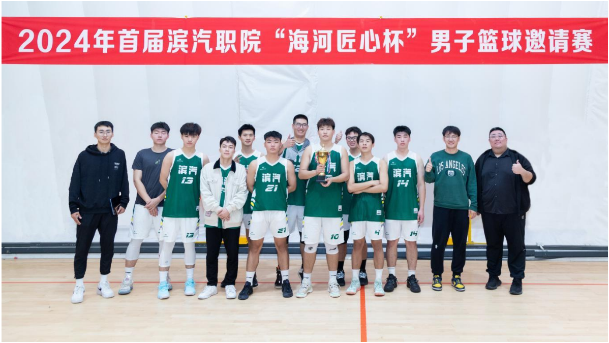
图 1-9 霸气十足的男子篮球队