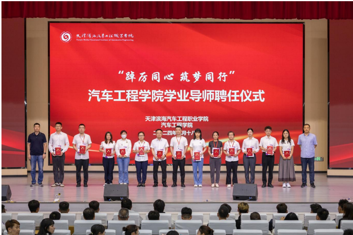
图2-9 学业导师聘任仪式