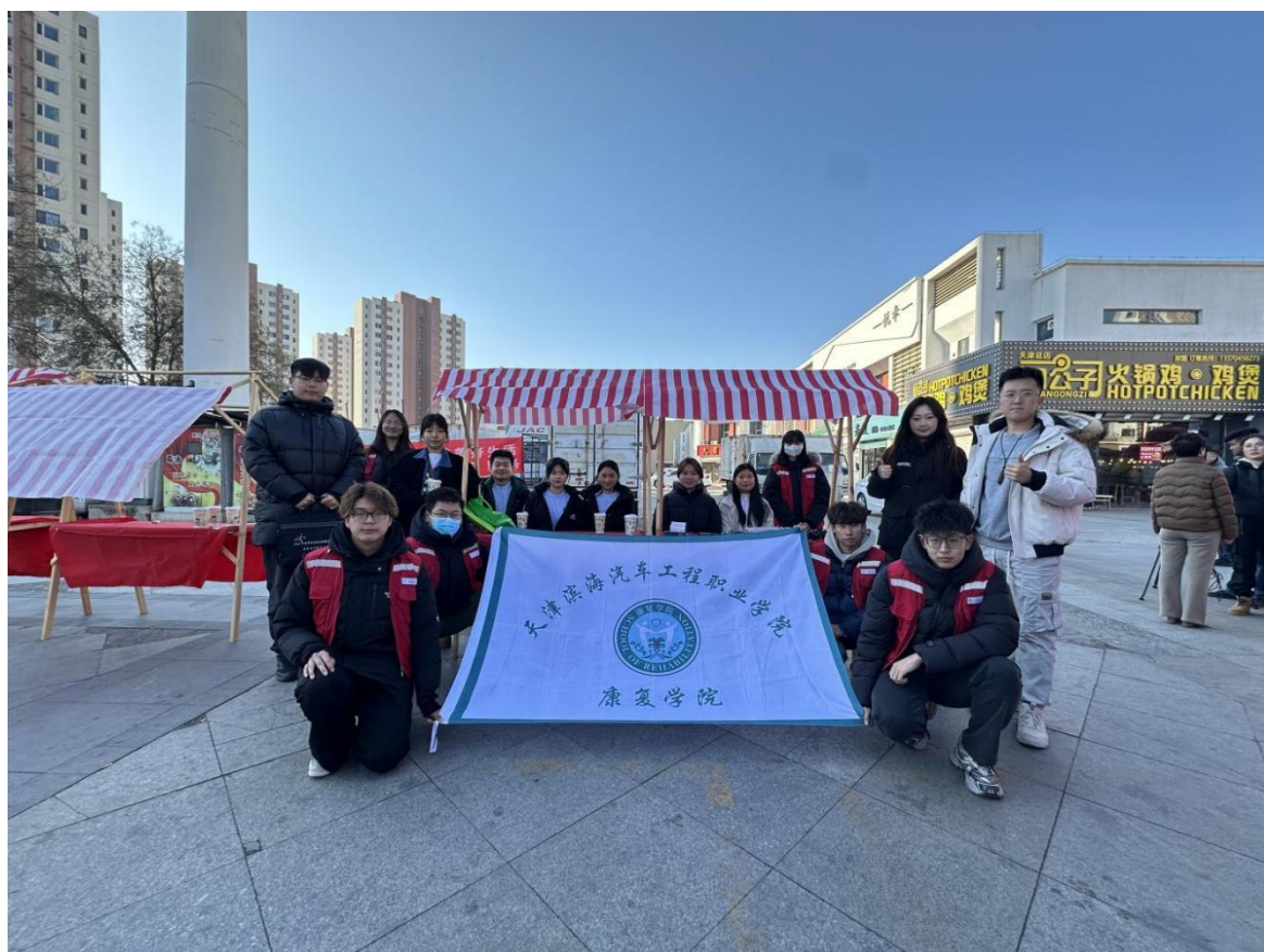
图3-7 同学们在葛沽镇开展志愿活动

从三月学雷锋月启动仪式开始，指导青年志愿者协会开展衣缘助力、无偿献血、健康义诊、卫生清扫、净滩行动等这些多样性的志愿服务活动共计30余次，无偿献血共有289名同学奉献出自己的爱心，衣缘助力服务站点正常投入运转活动6次，共收集衣物896件，净滩行动6次共进行6次水质测评。（如图3-7、图3-8，图片来源：学校新媒体中心）