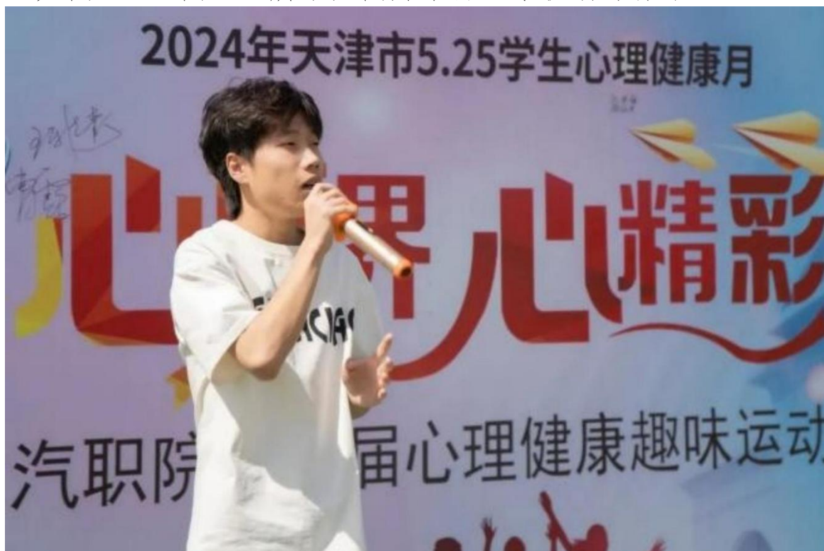
图1-3 心理健康月宣传活动