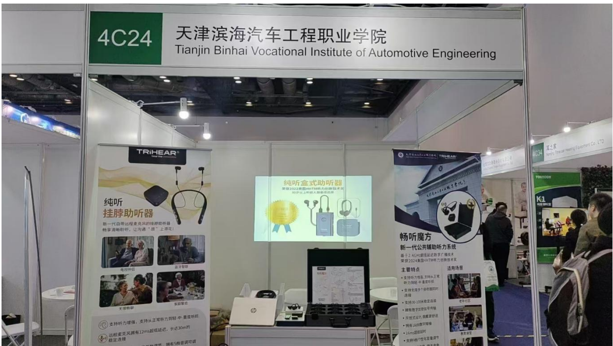
图3-6 校企合作自主研发产品参展