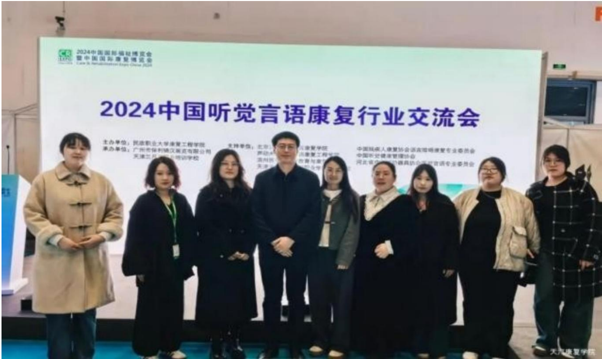
图3-5 师生在北京参加交流会