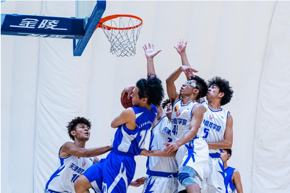
图 1-10 竞争激烈的比赛现场