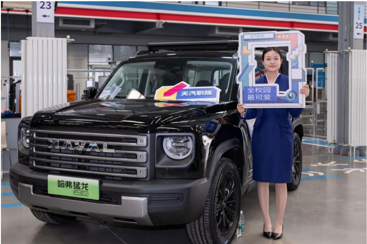
图2-12 空乘专员在车展现场服务