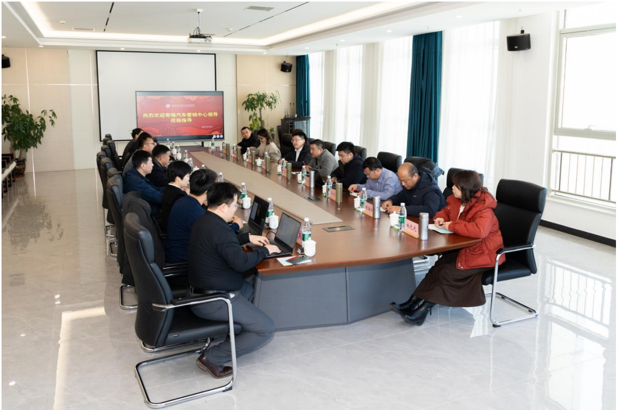
图2-4 校企共商校园展厅方案