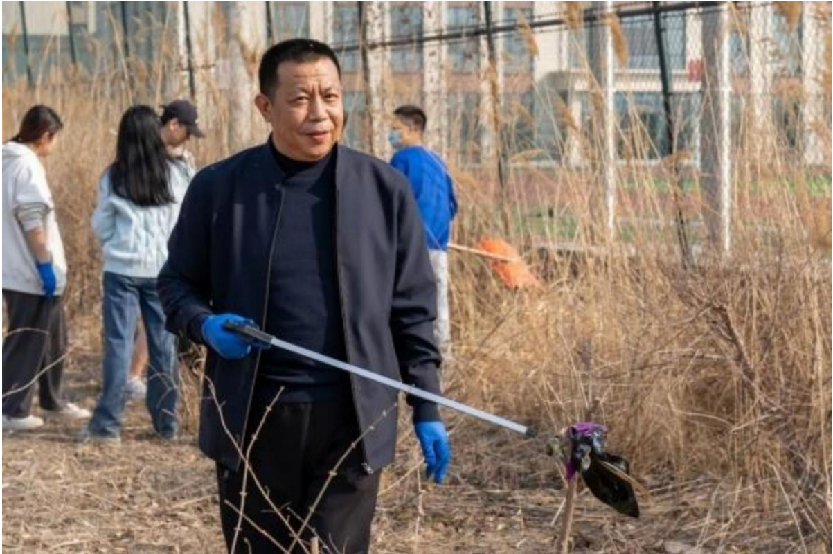
图 1-11 校领导带头参加劳动