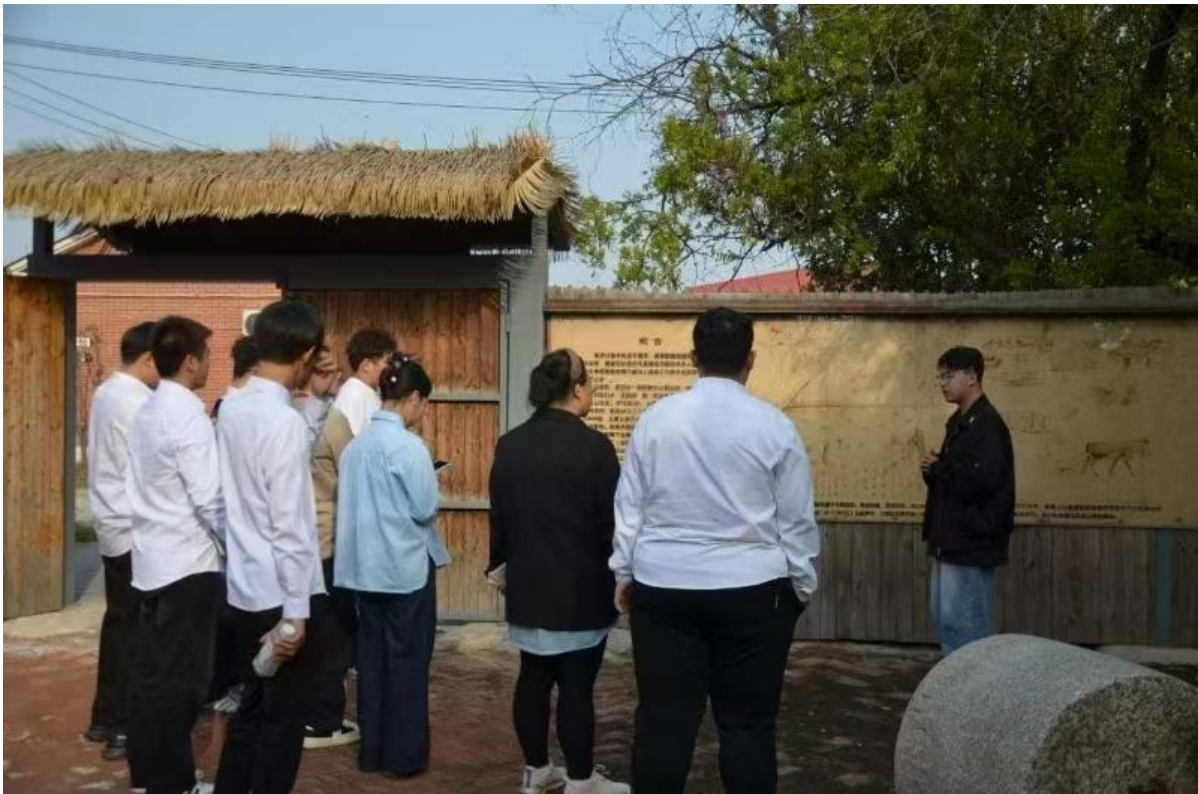
图3-2 师生在村史馆了解前进村发展历史