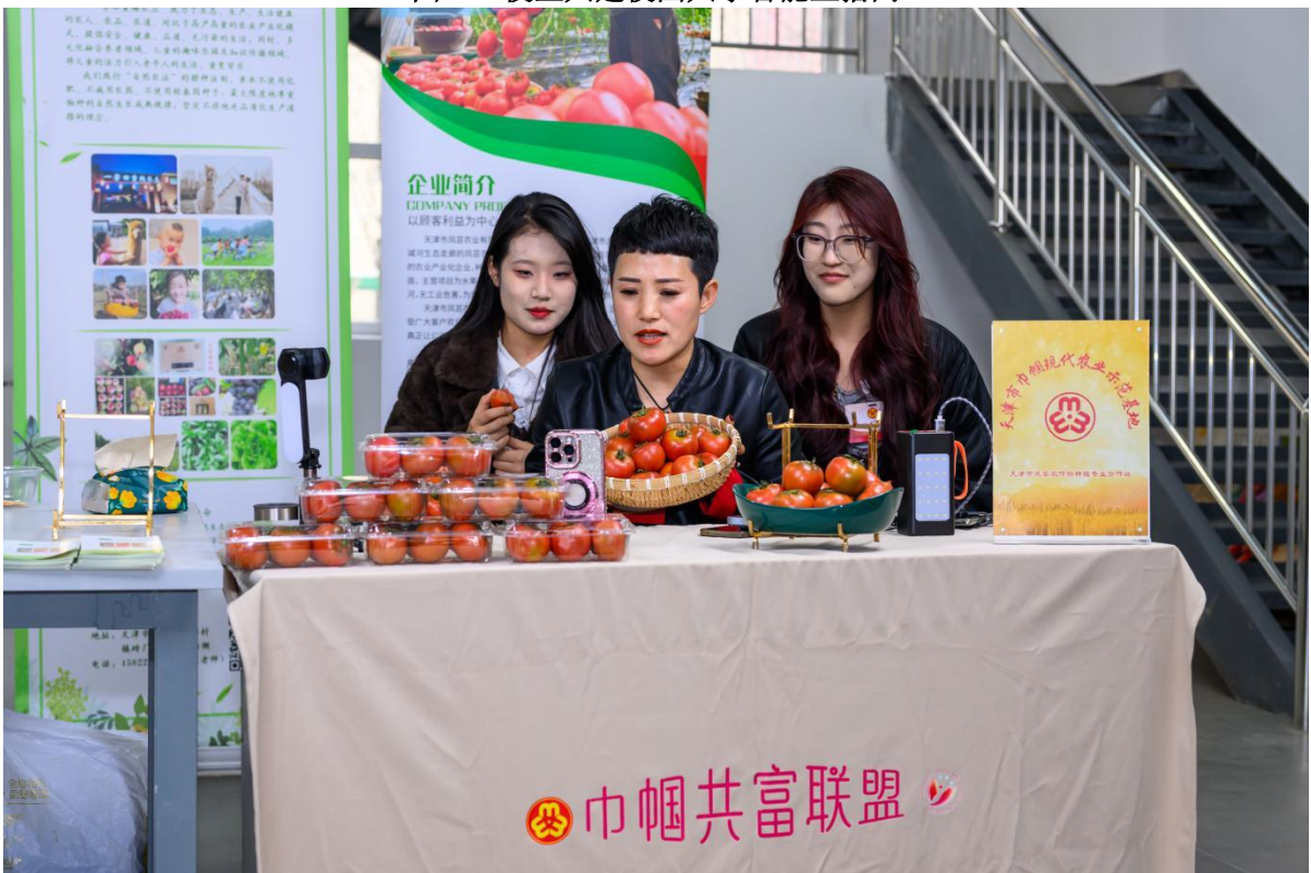
图3-4 同学们在直播间为农产品直播带货