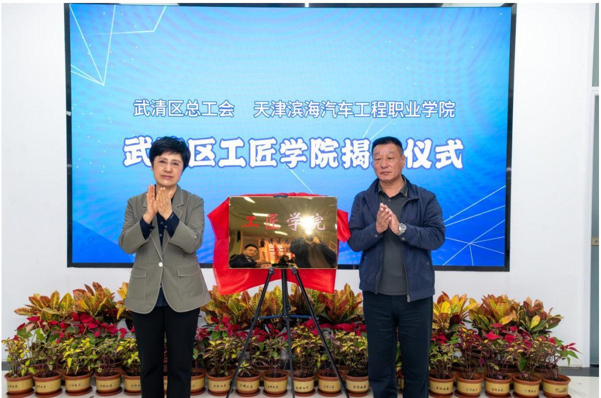
图5-3 武清区领导为工匠学院授牌