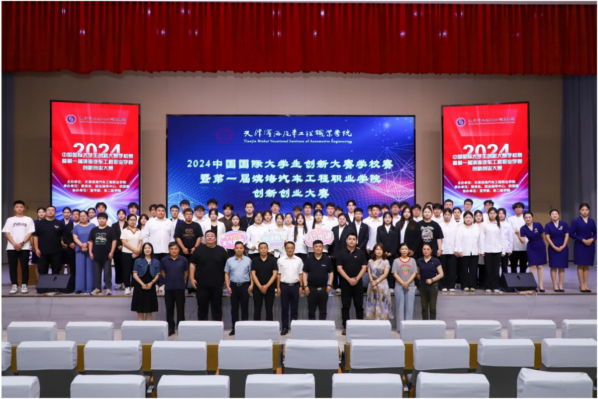
图4-7 参赛师生合影留念