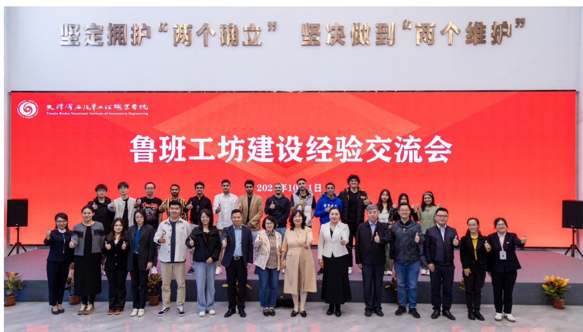
图4-1 中外师生参观思政主题教室

学校秉承开放包容、合作共赢的理念，与更多国内外高校携手共进，共同推动职业教育的国际化发展。（如图4-1、图4-2、图4-3所示）