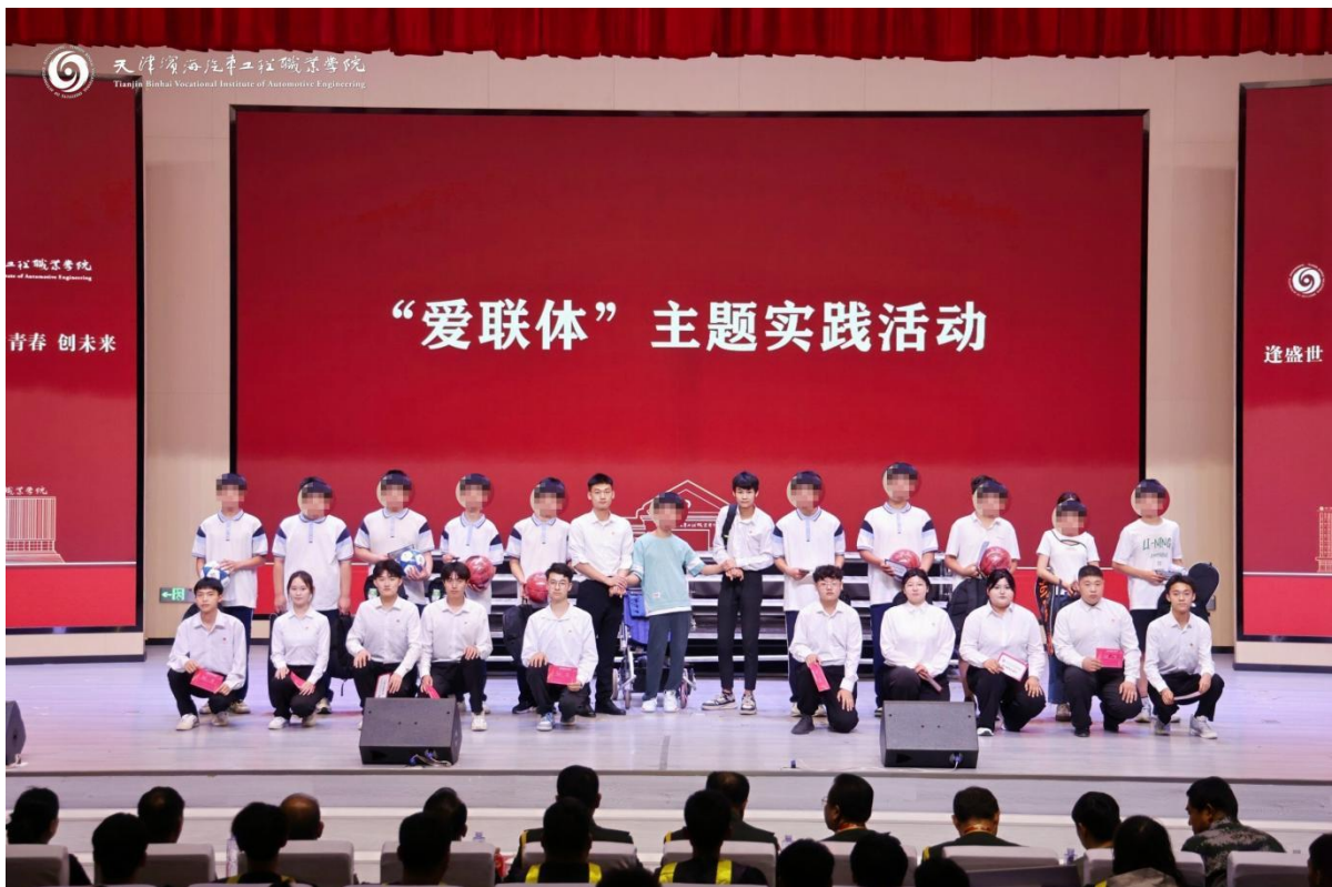
图1-8 爱联体主题实践活动表彰大会