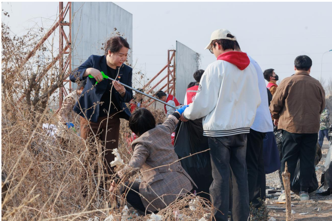
图 1-12 师生在校园周边清理环境卫生