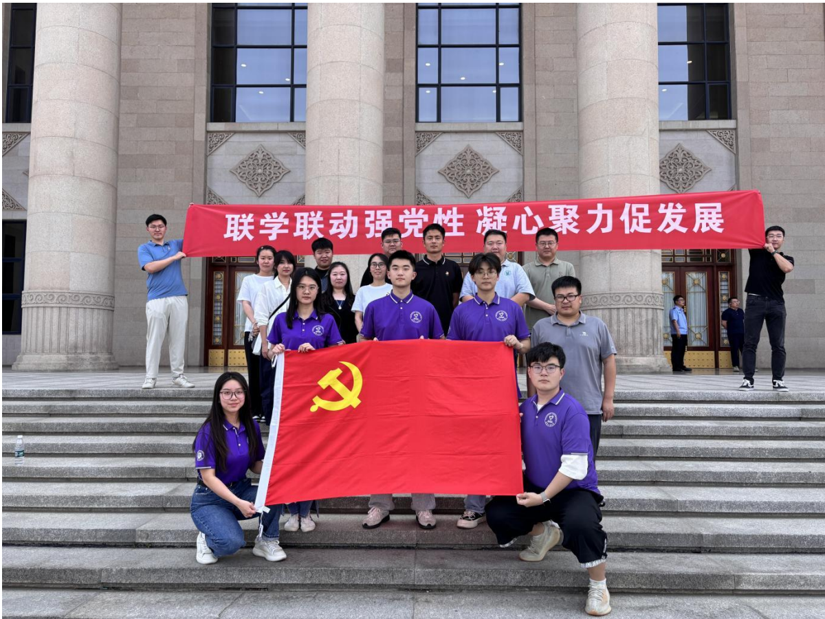
图6-6 师生开展党建结对共建活动