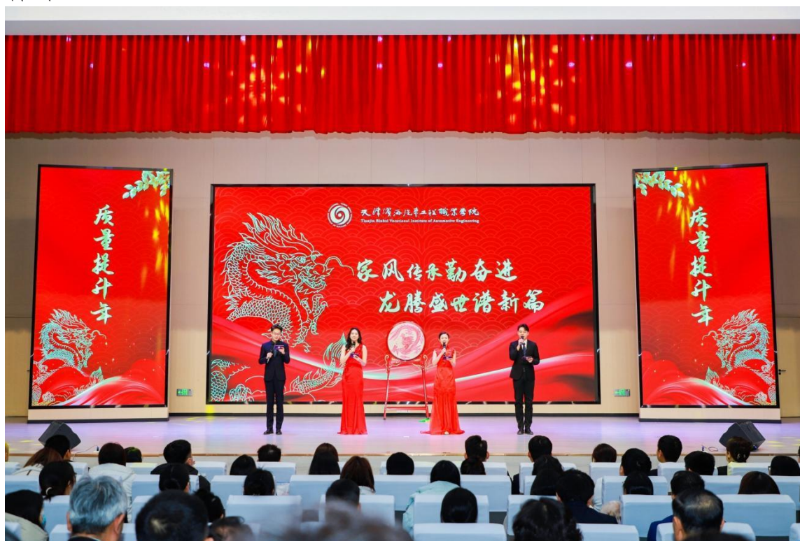
图1-1 家风家教主题活动

学校持续组织学生参与各类社会实践活动，如“致敬英雄·关爱儿童”的“爱联体”主题实践活动、“爱国爱家爱校”家风家教宣讲分享会等，让学生在实践中受教育、长才干、作贡献，三全育人效果明。（如图 1-1、1-2 所示）