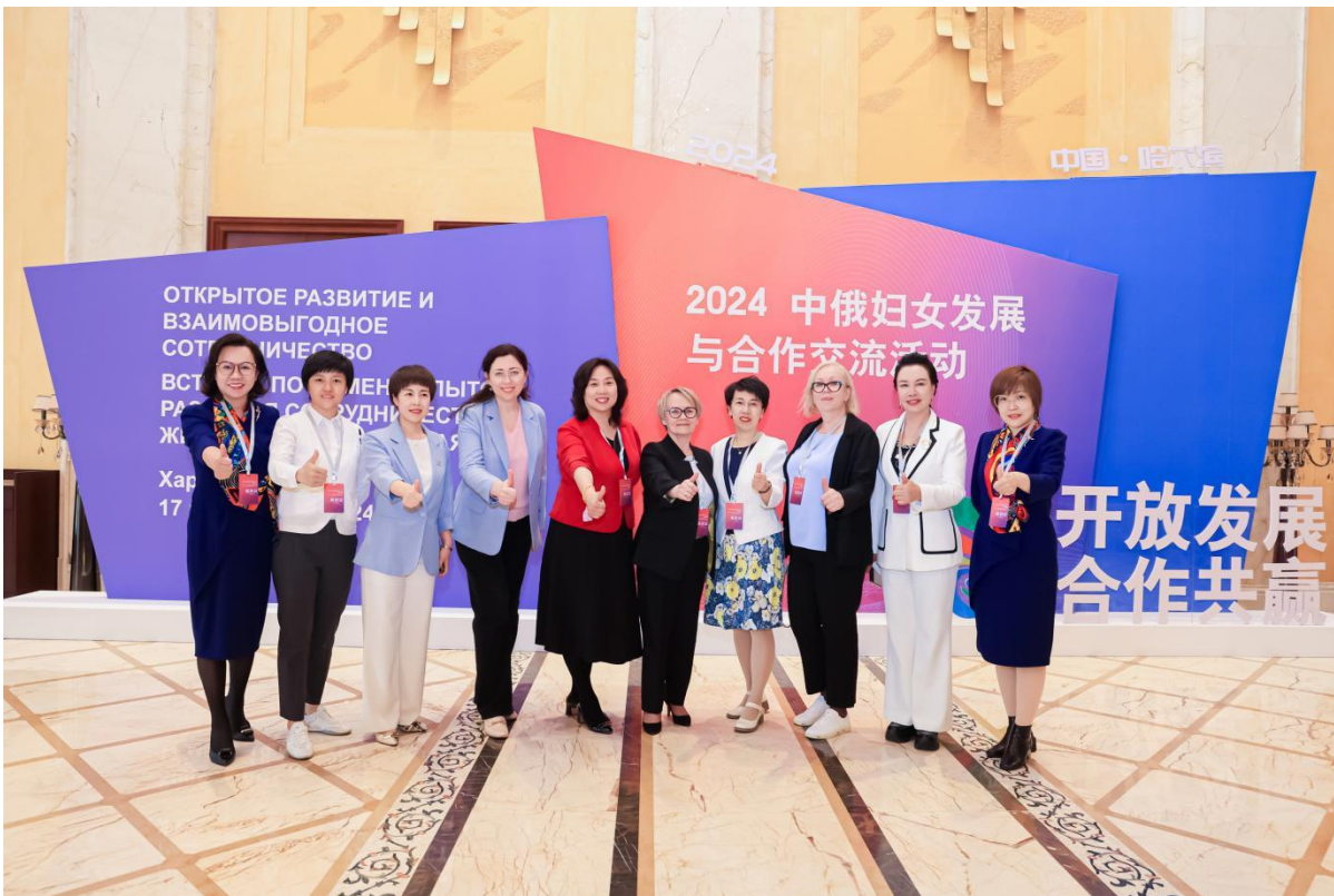
图4-5 理事长与中俄代表合影留念