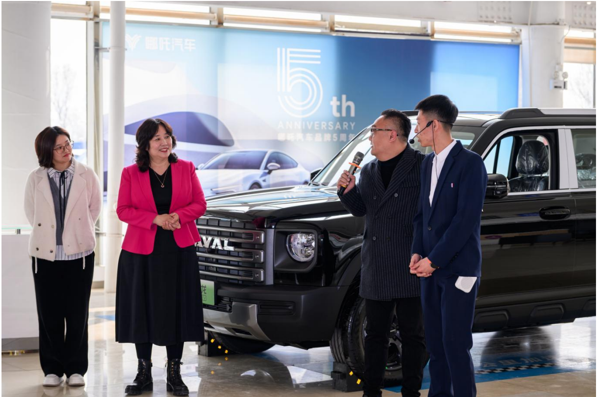
图2-1 创新完善“五好基地”内涵建设