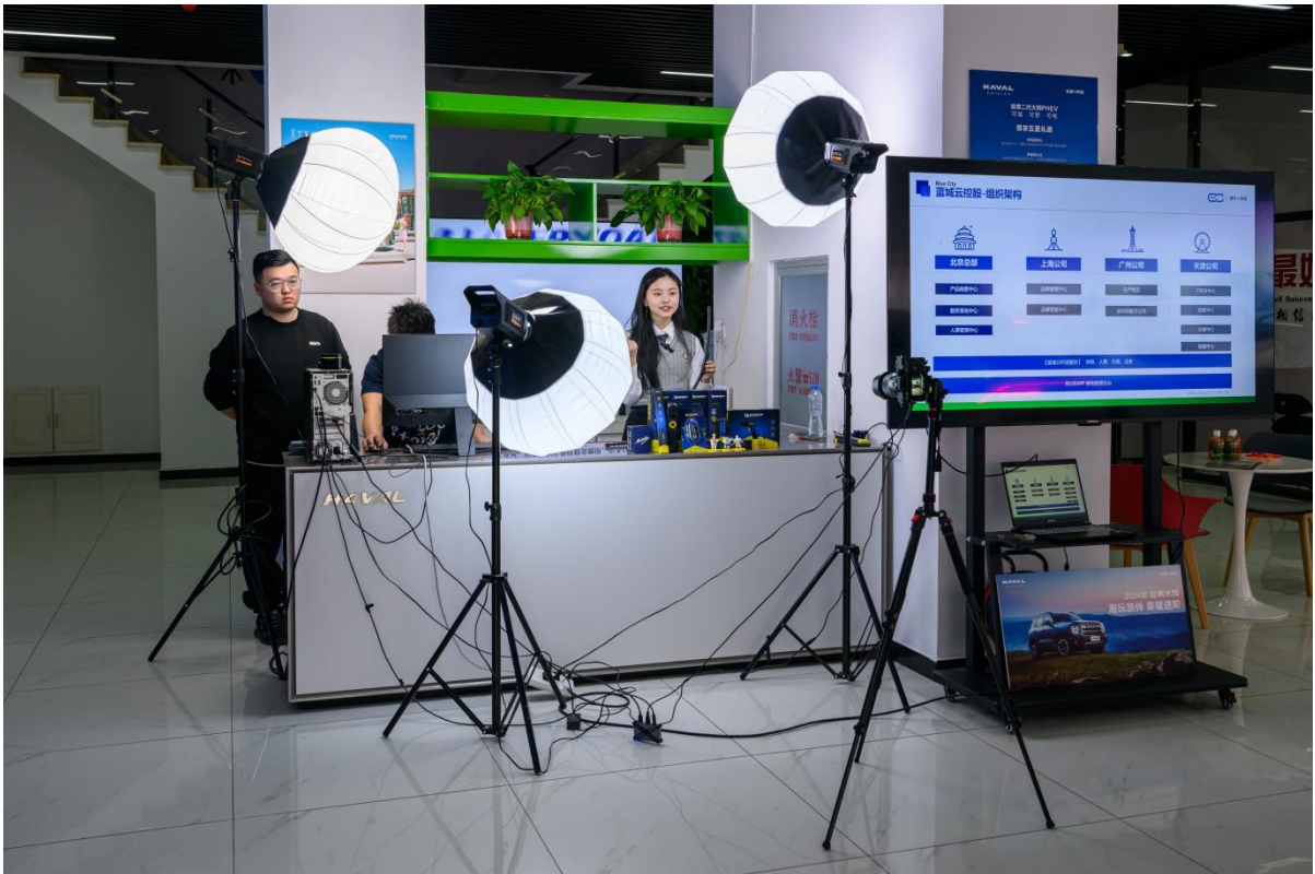
图3-3 校企共建校园共享智能直播间