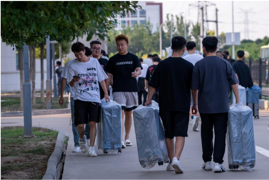
图6-7 同学们领到行李箱