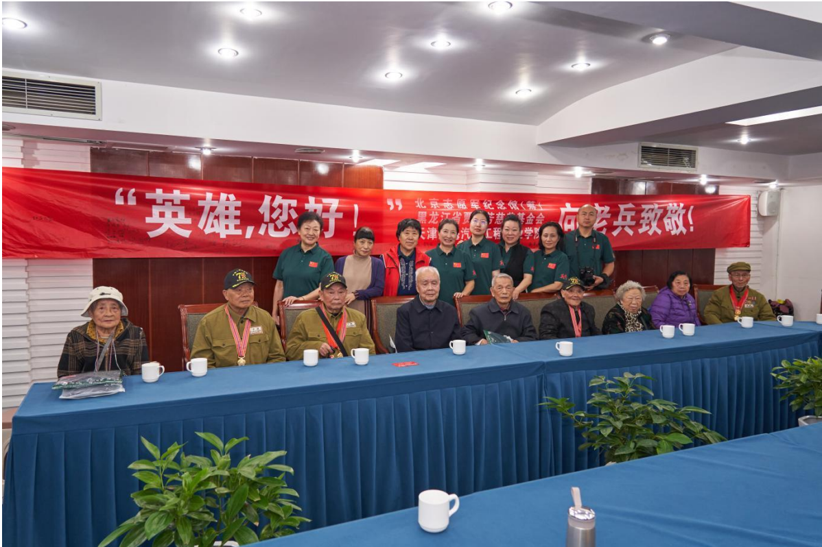
图5-5 师生在四川慰问英雄老兵