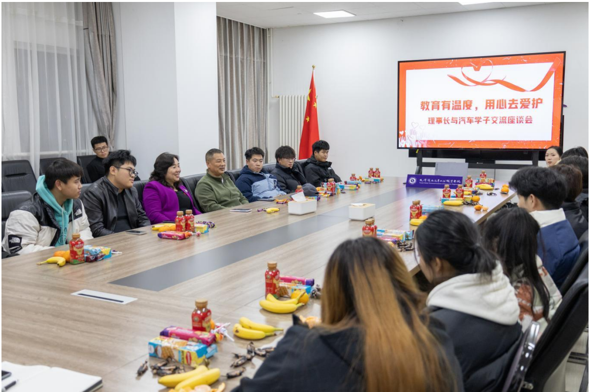
图6-4 师生共同交流学校情况