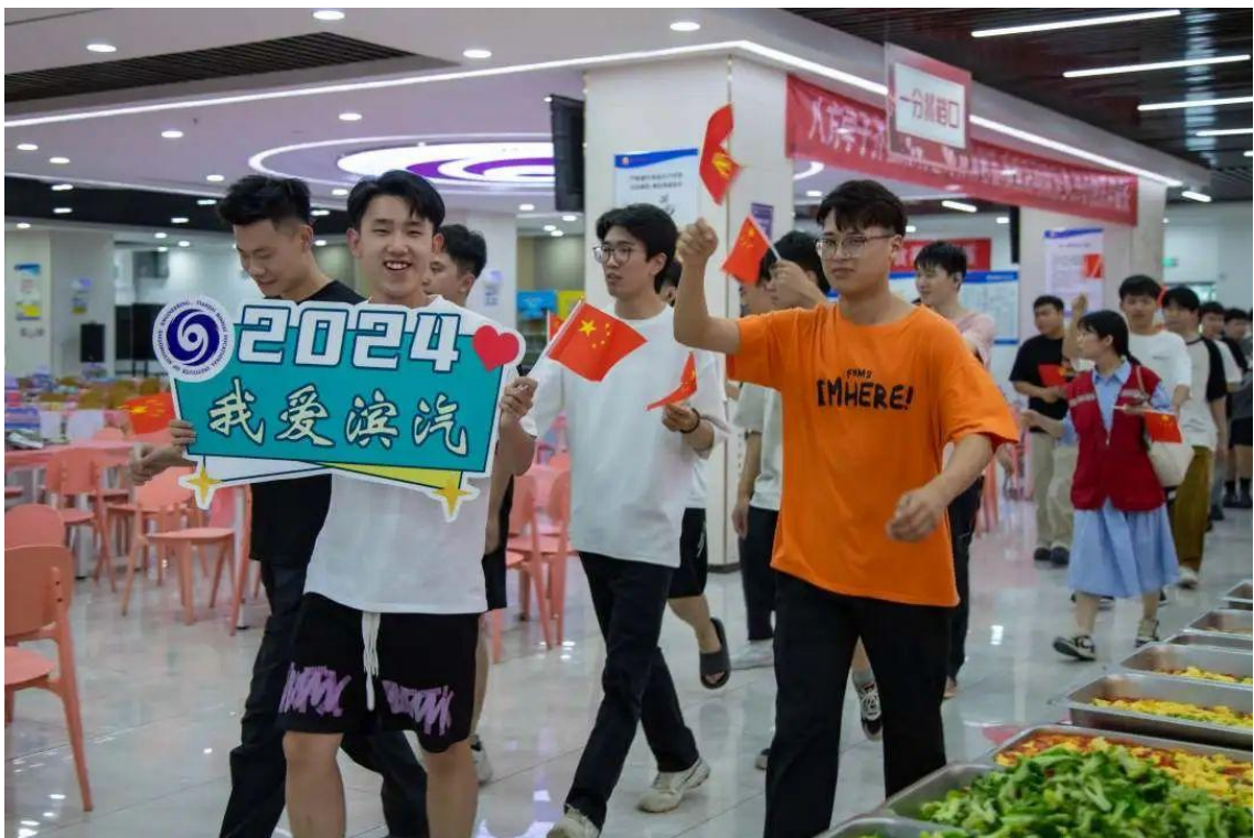
图6-8 学校在食堂为同学们准备的“千人同吃出发宴”