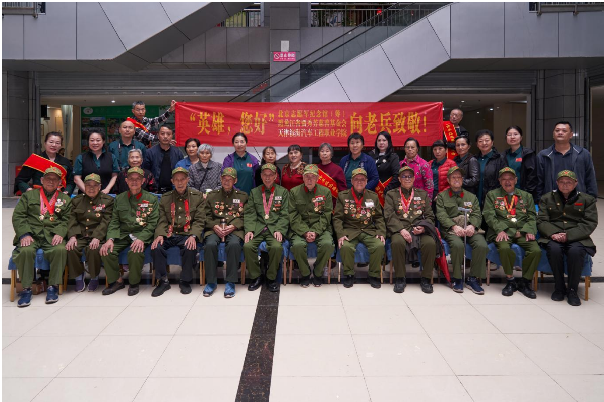
图5-6 师生在重庆慰问英雄老兵