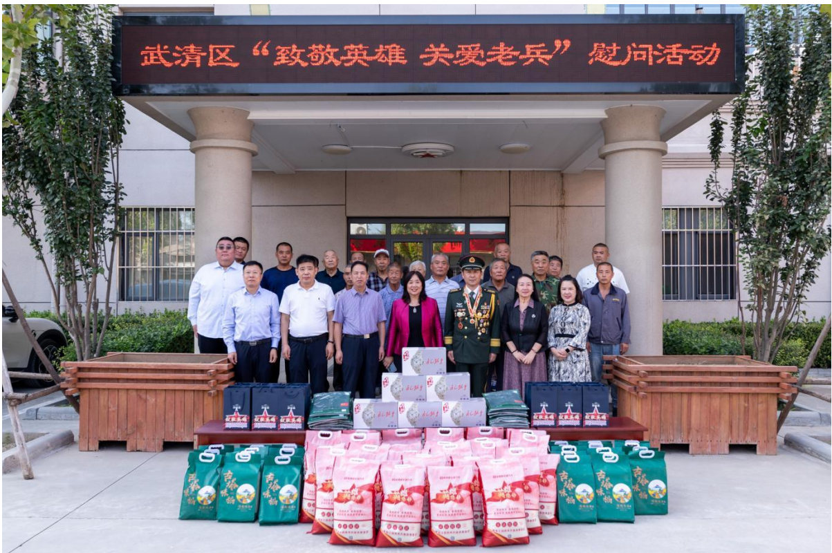
图1-7 师生在武清区致敬英雄慰问活动