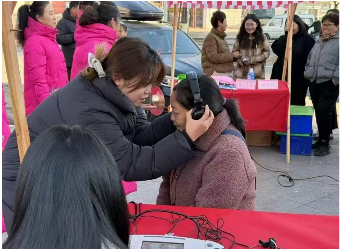
图3-8 康复学院师生为市民义诊