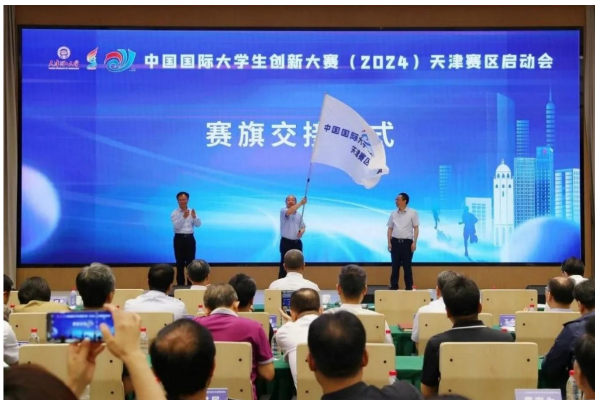
图4-6 国际大学生创新大赛赛旗交接仪式

学校举办第一届创新创业大赛，并参加2024年中国国际大学生创新大赛校赛。（如图4-6、图4-7所示）