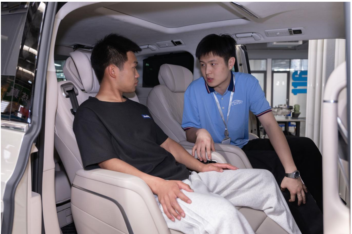
图2-13 学生为顾客解说汽车性能