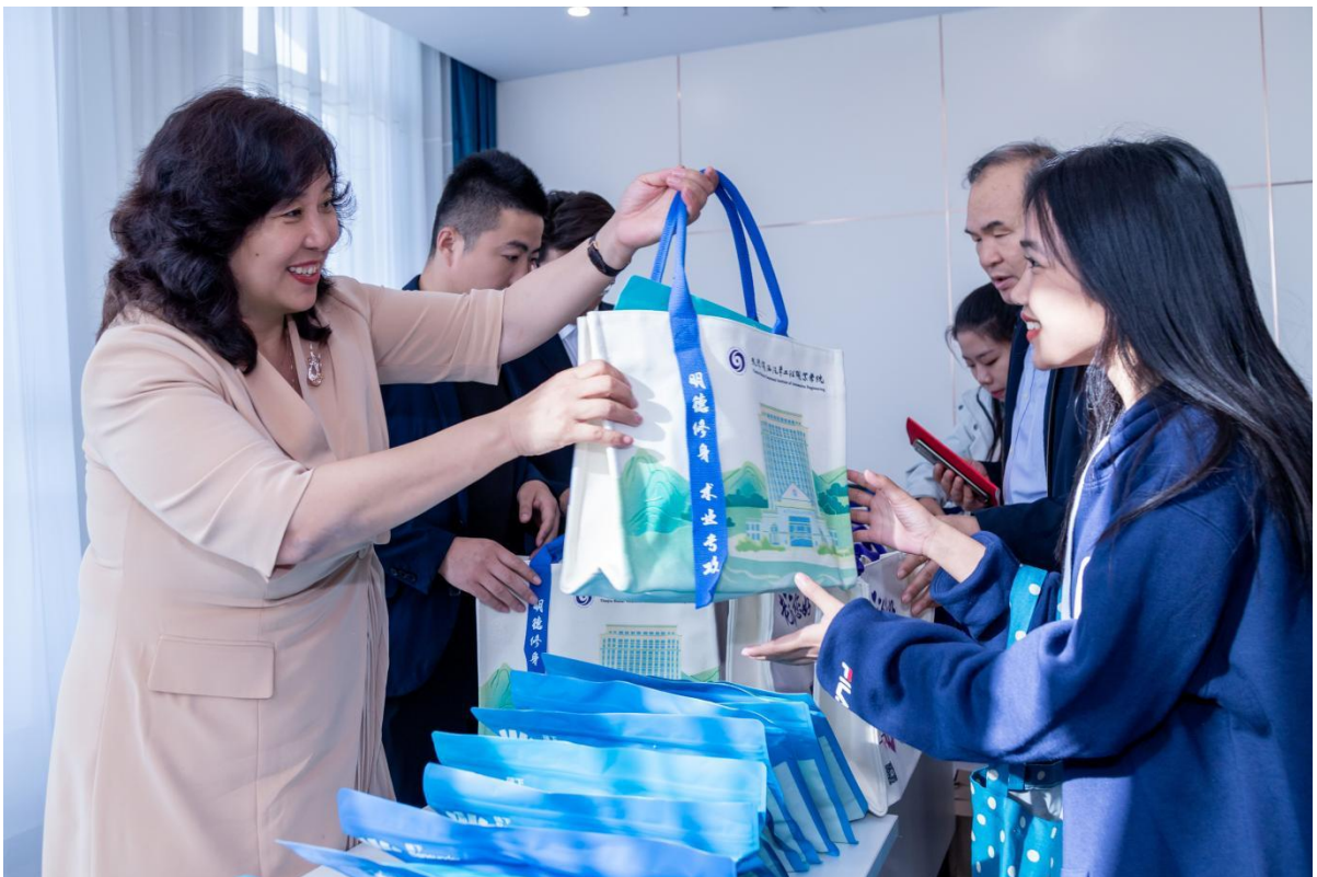
图4-3 理事长赠送留学生礼物