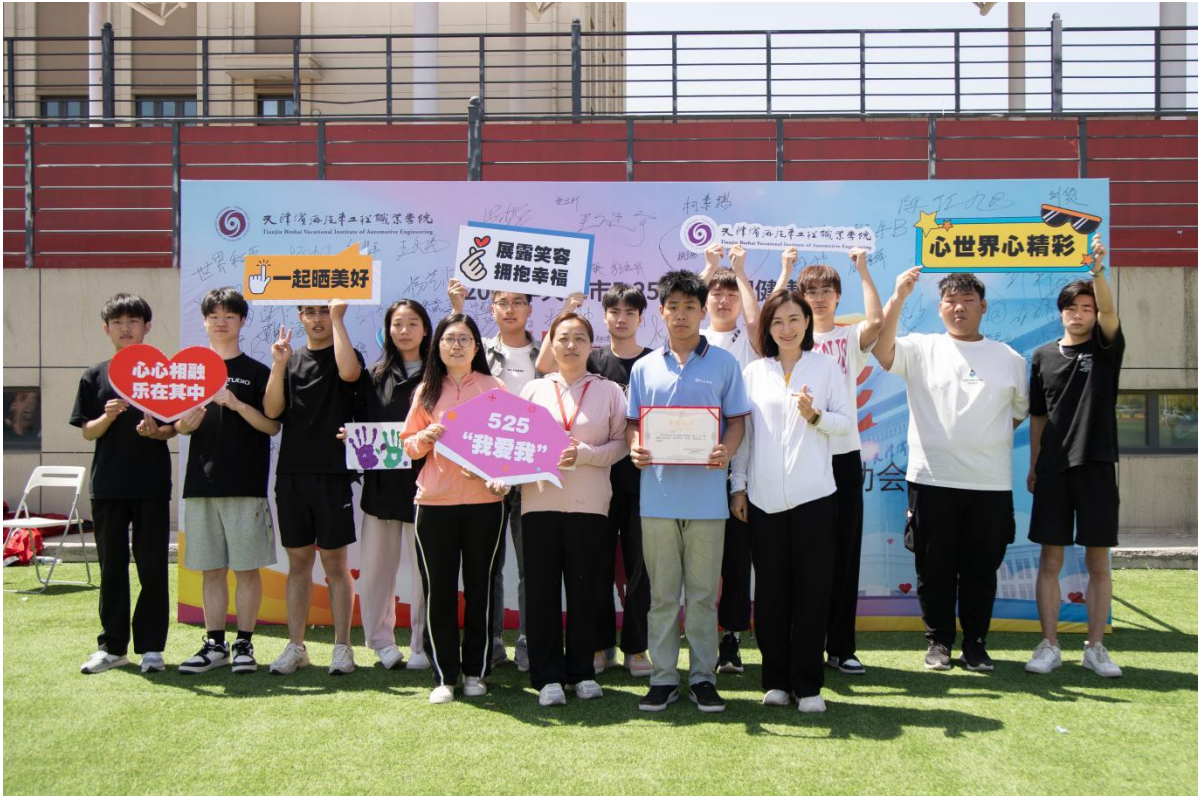
图1-4 召开趣味运动会