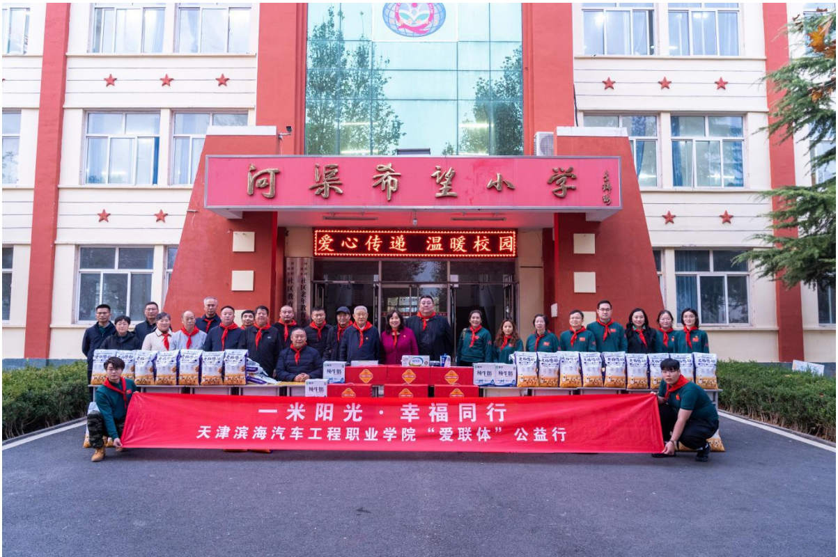
图1-6 师生在河北省开展关爱儿童活动