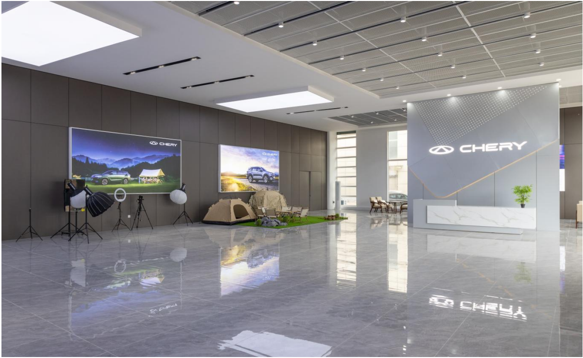
图2-3 奇瑞校园展厅建设