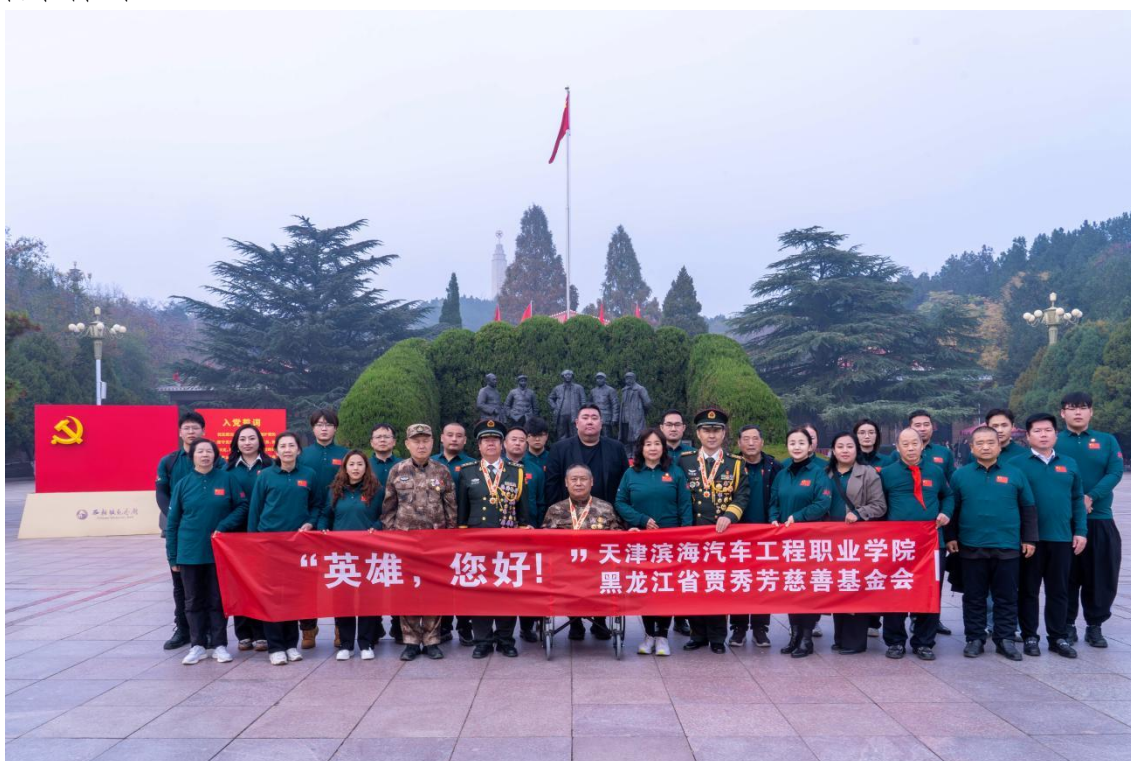
图1-5 开展“英雄，您好！”致敬英雄活动

学校开展德育新举措，“致敬英雄·关爱儿童”爱联体主题实践活动。（如图 1-5、1-6、1-7、1-8 所示，图片来源：学校新媒体中心）