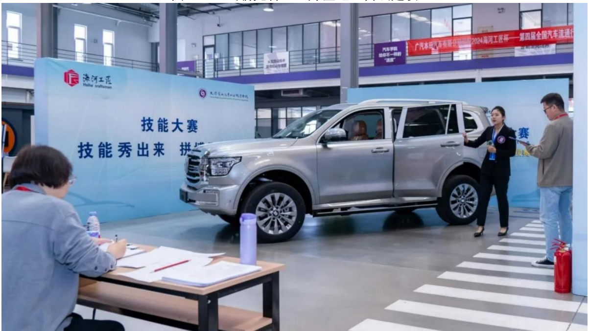
图2-2 在实训基地以赛代课